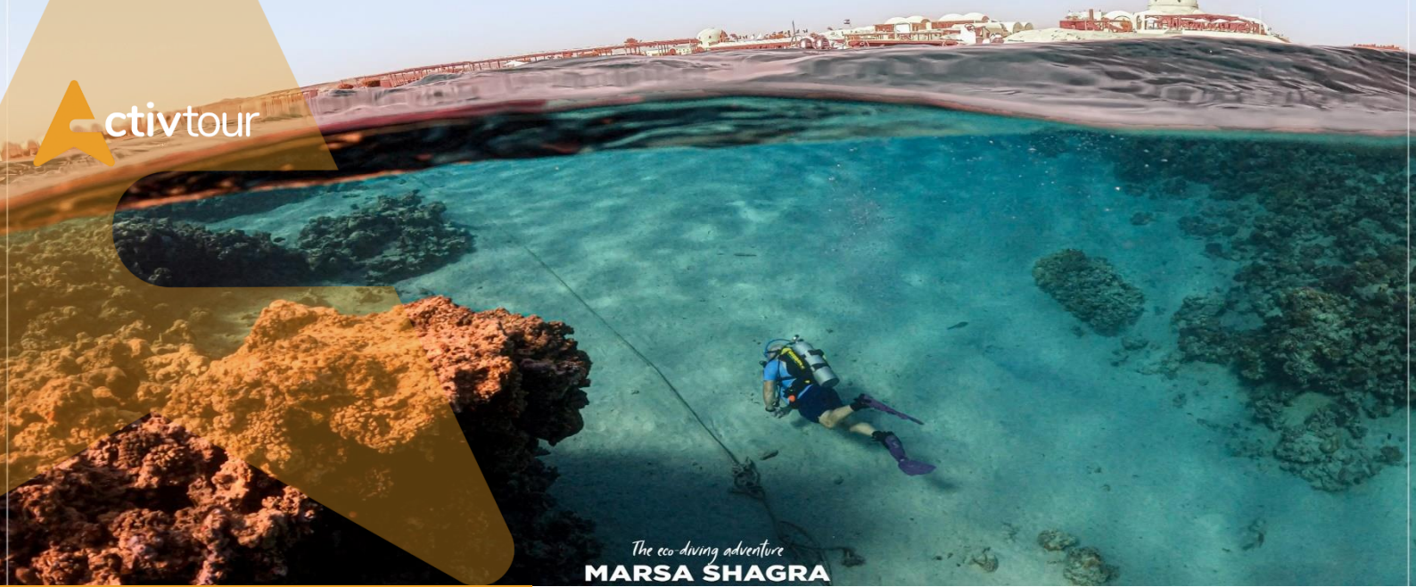
The eco-diving adventure MARSA SHAGRA