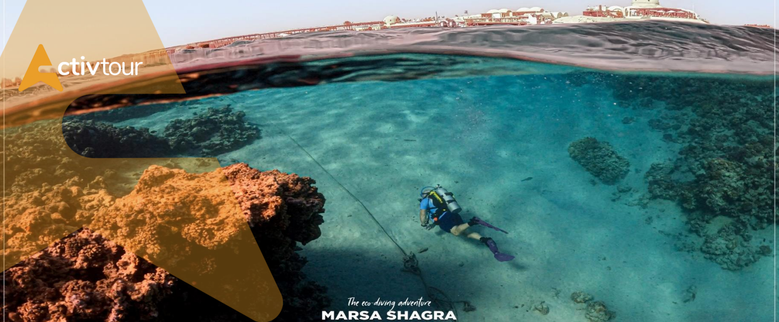
The eco-diving adventure MARSA SHAGRA