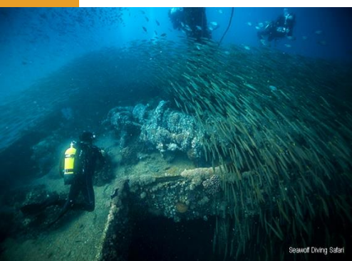
Seawolf Diving Safari